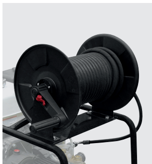
15/20 mt hose reel kit (on request) Kit avvolgitubo con tubo 15/20 mt (su richiesta)