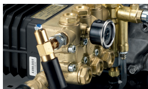
RPM decelerator kit Kit deceleratore di giri motore